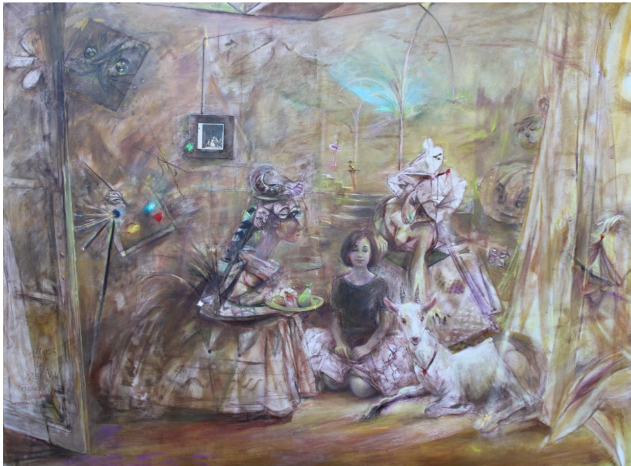
Las Meninas 140x187cm olej na płótnie 2023