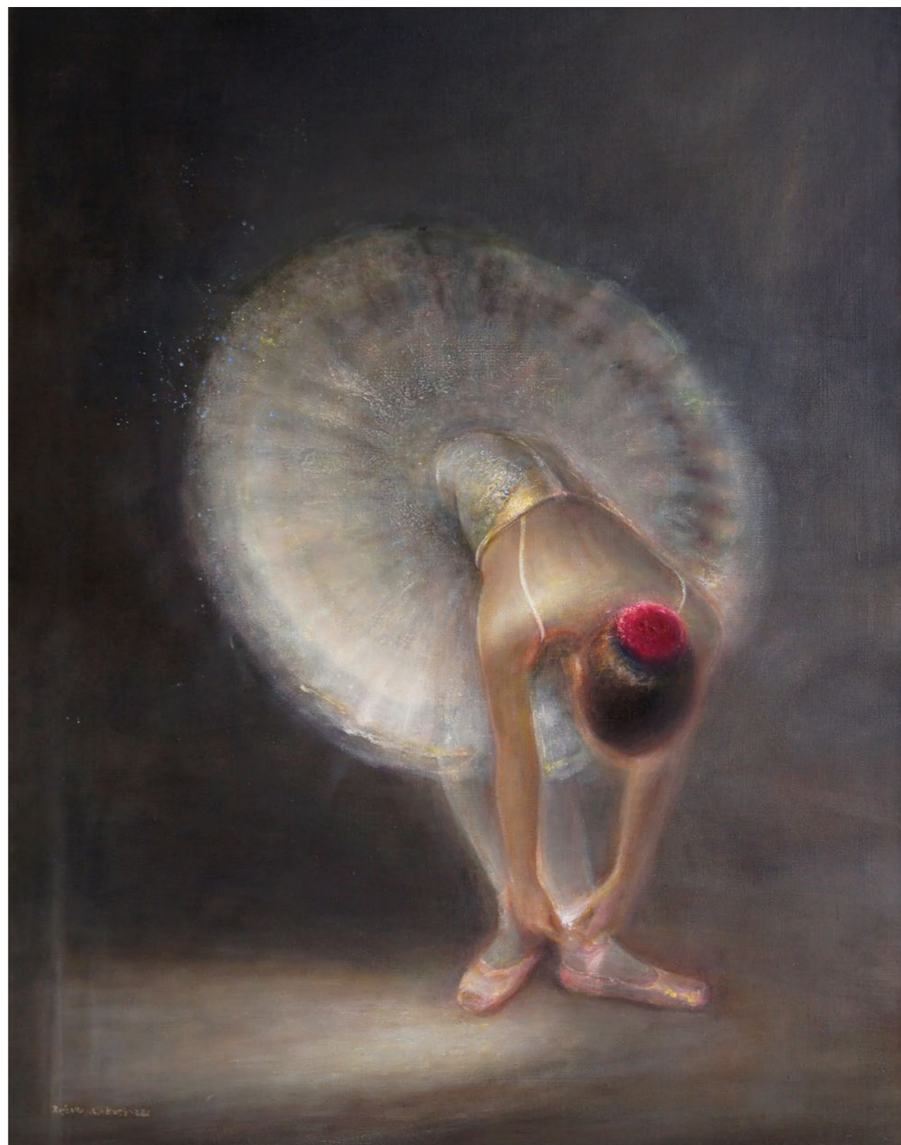
Baletnica z czerwonym koczką 120x80cm olej na płótnie 2022