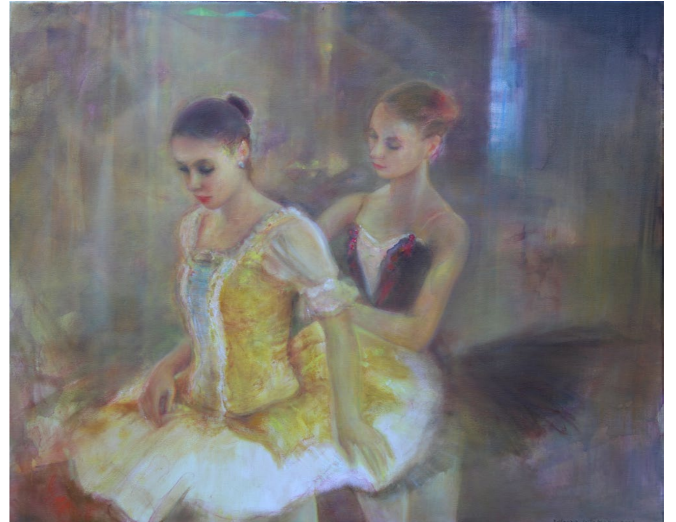
Chwila przed spektaklem 80x100cm olej na płótnie 2024