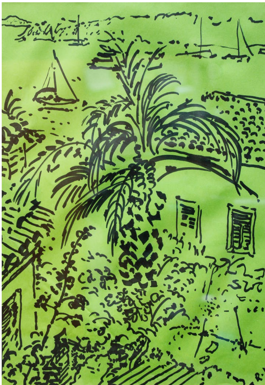
Rogoźnica 28x20cm rysunek 2014