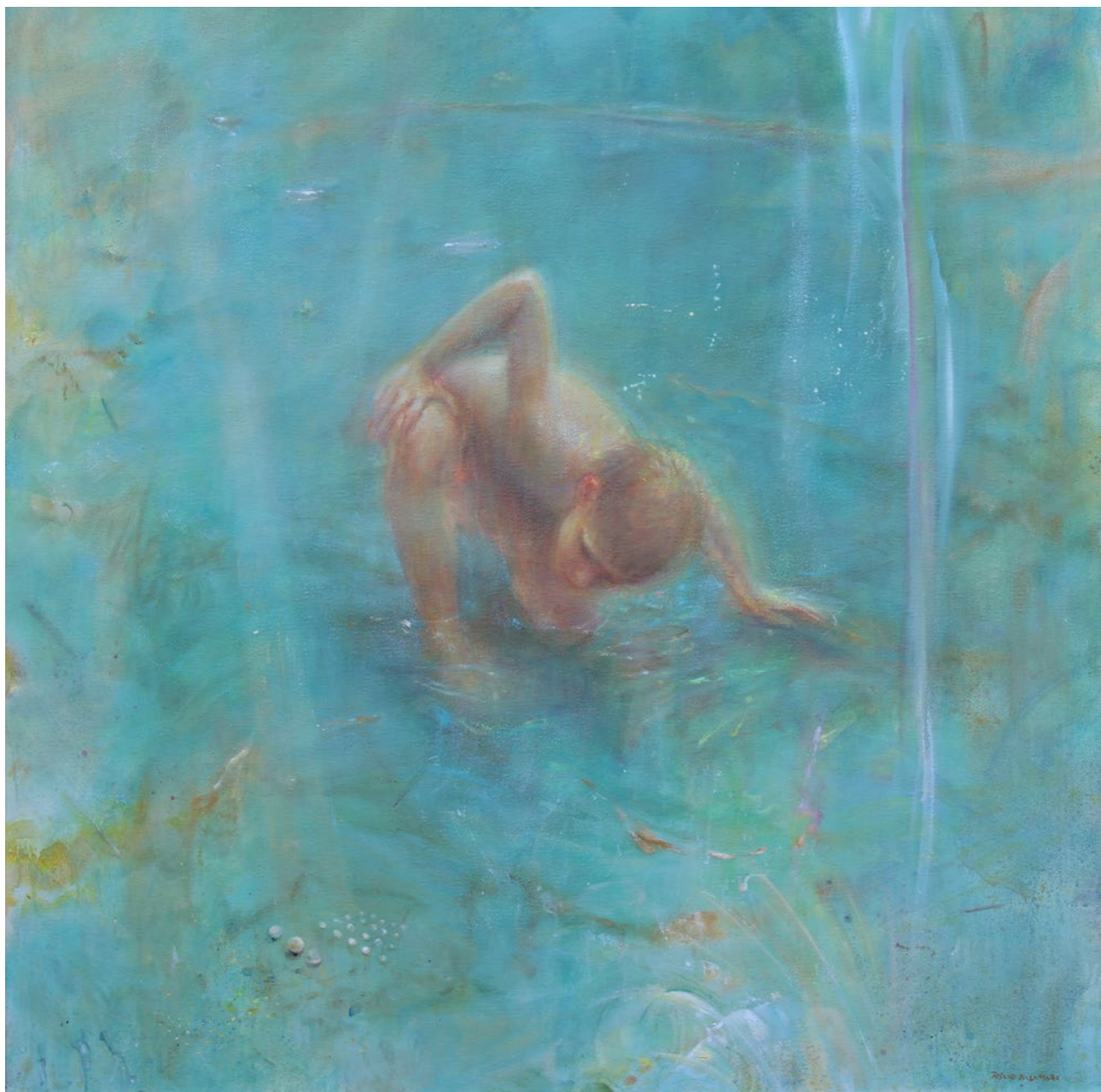
Prążródło 100x100cm olej na płótnie 2023