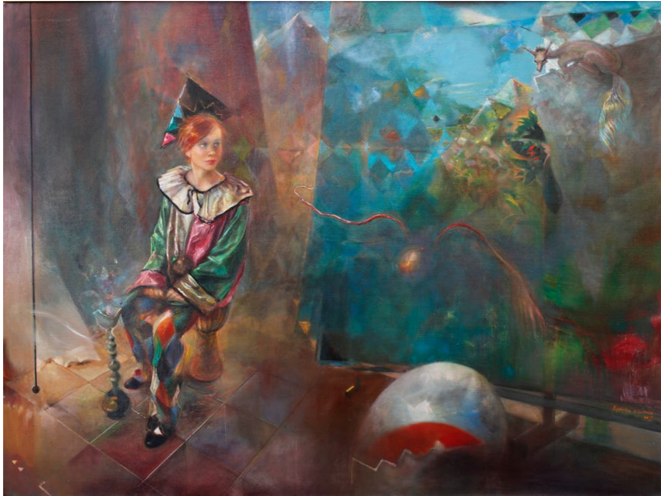
Pejzaż z arlekinem 120x160cm olej na płótnie 2017