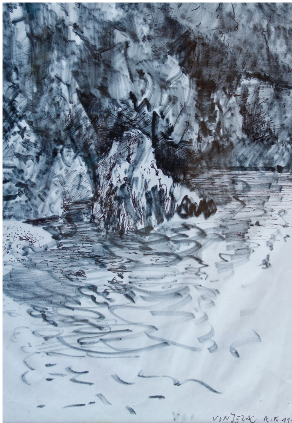
Zatoczka w Vinjerack 28x20cm rysunek 2014