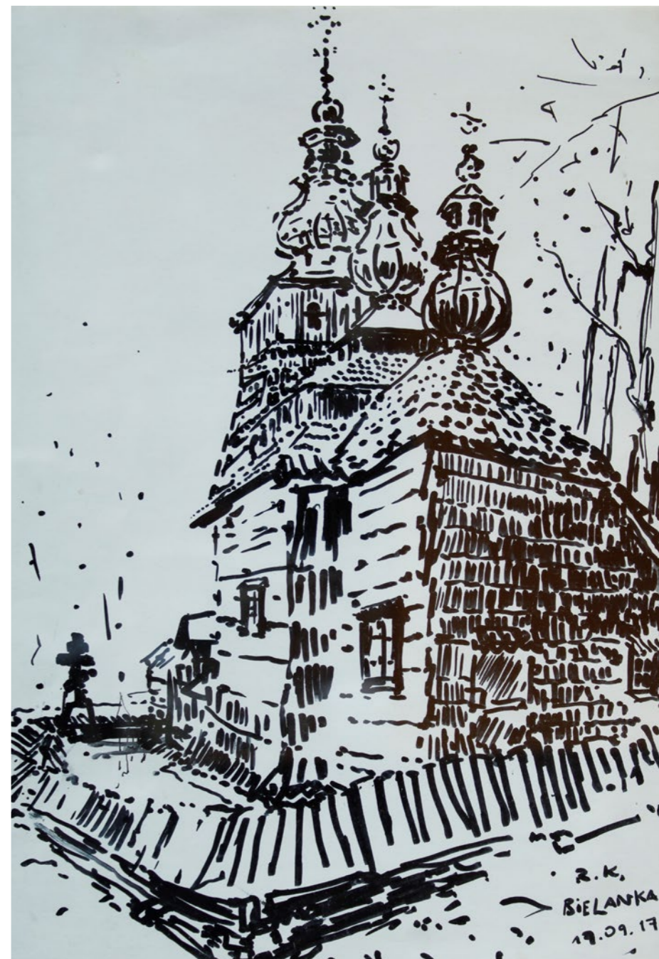
Cerkiew w Bielance 30x20cm rysunek 2017