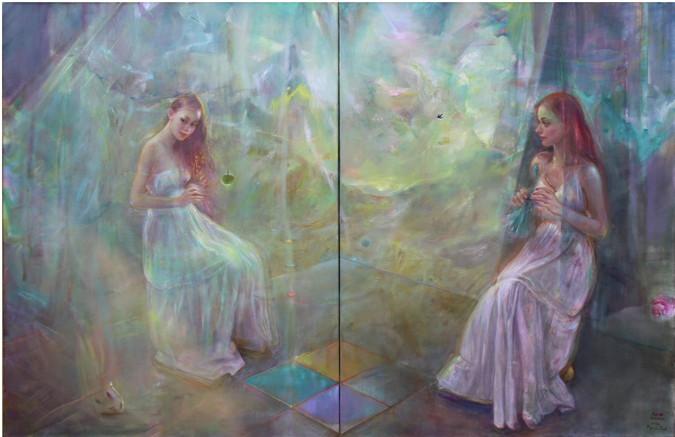
Pejzaż z Toledo 130x200cm olej na płótnie 2022

Arkadiusz Kuczyński 2022 Pejzaż z Toledo