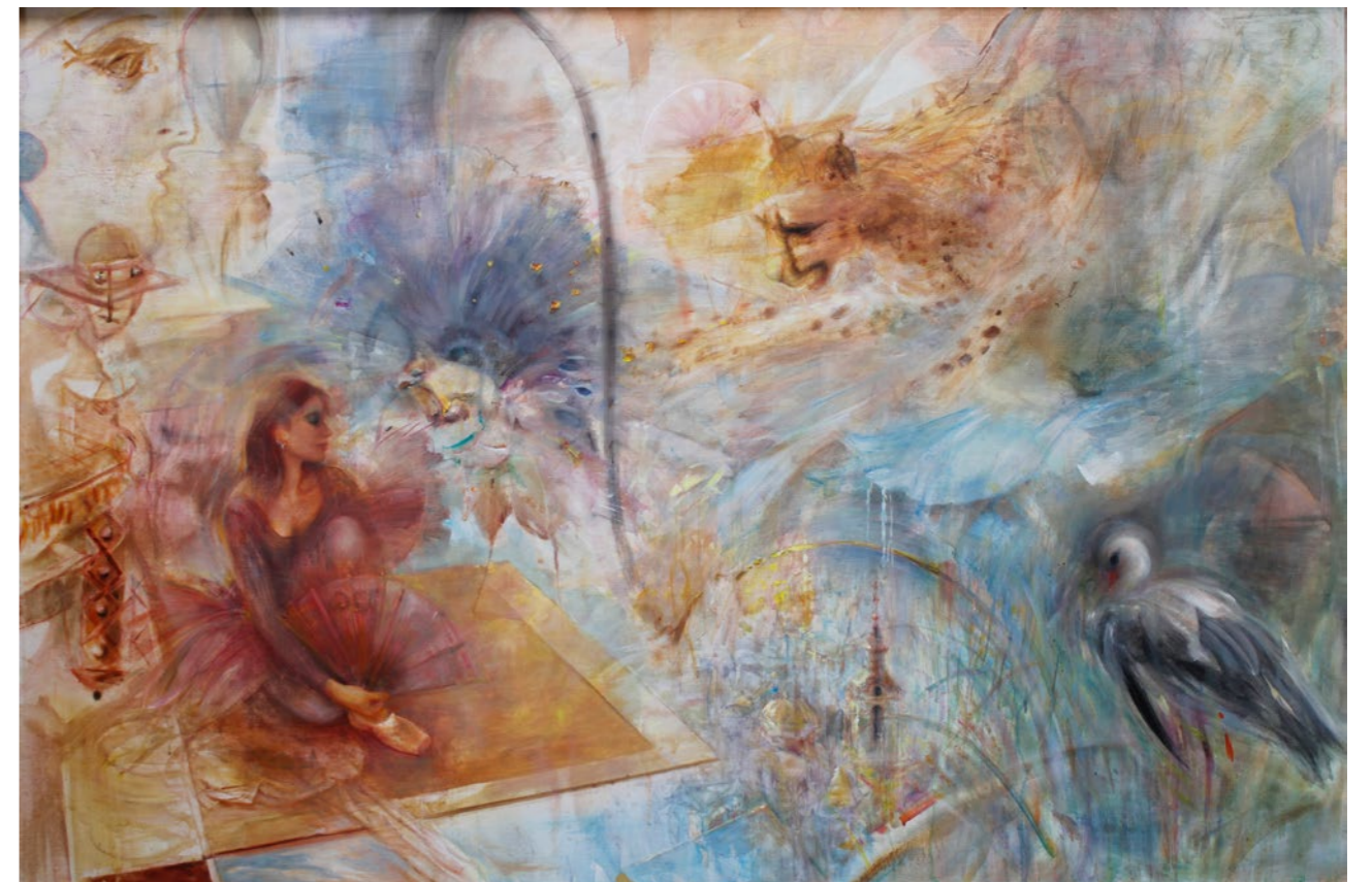
Skok rysia na Przemysł 120x180cm olej na płótnie 2017