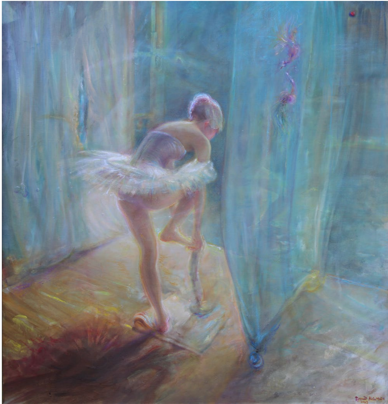
Za kulisami 110x105cm olej na płótnie 2023