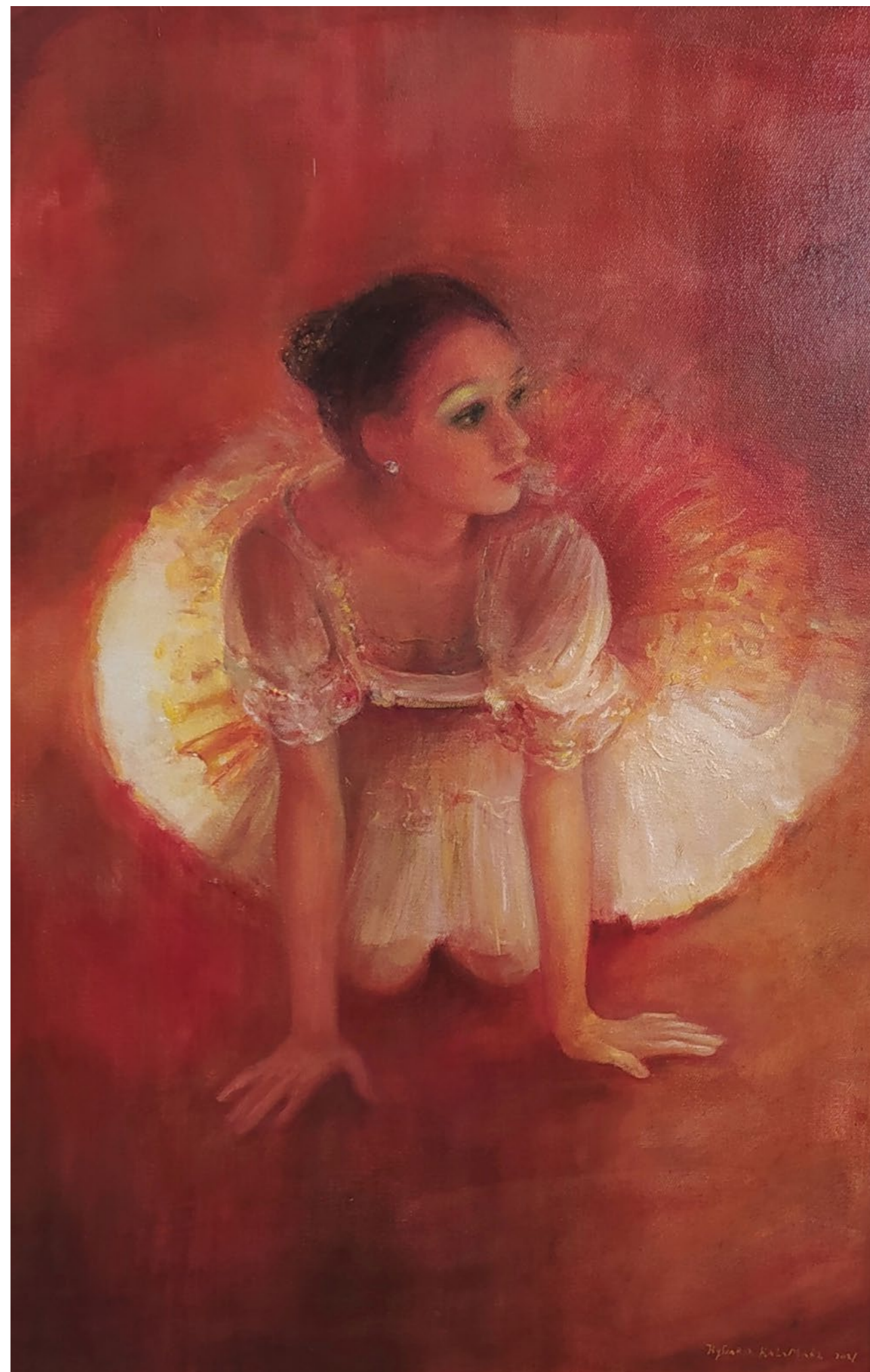
baletnica w białej paczce w czerwieni 90x60cm olej na płótnie 2021