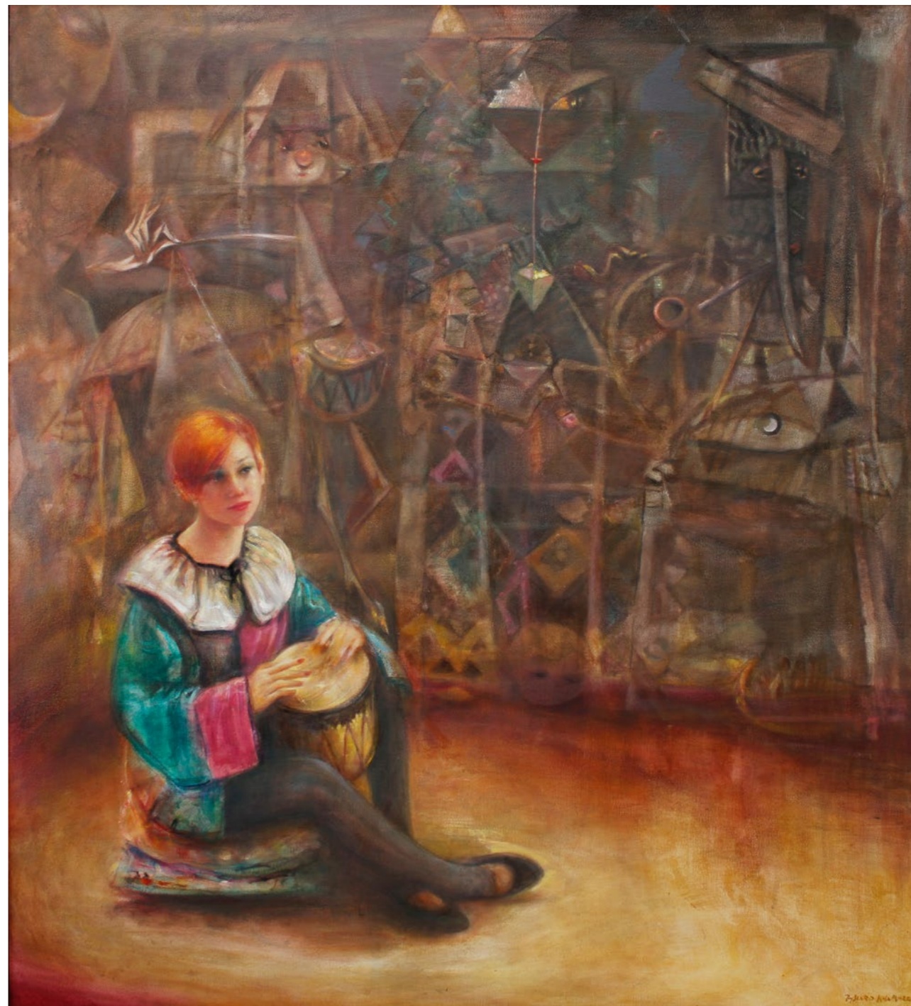
Lama, Lew, Mag, Dyrygent 129x116cm olej na płótnie 2019