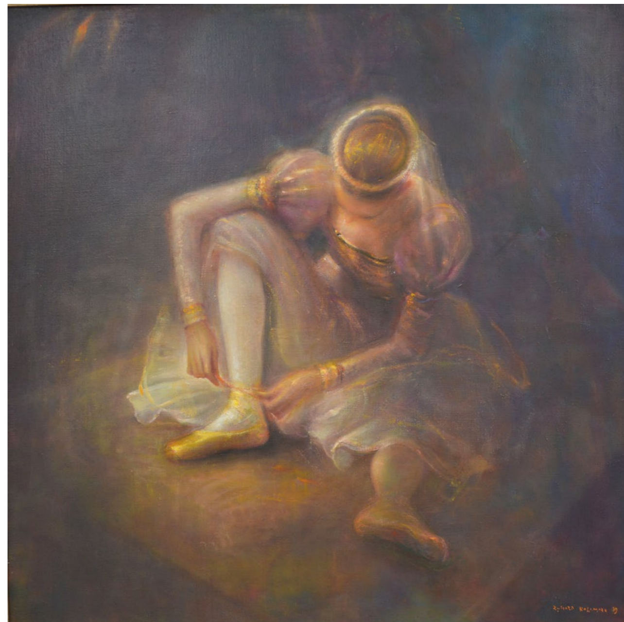
Baletnica 80x80cm olej na płótnie 2022