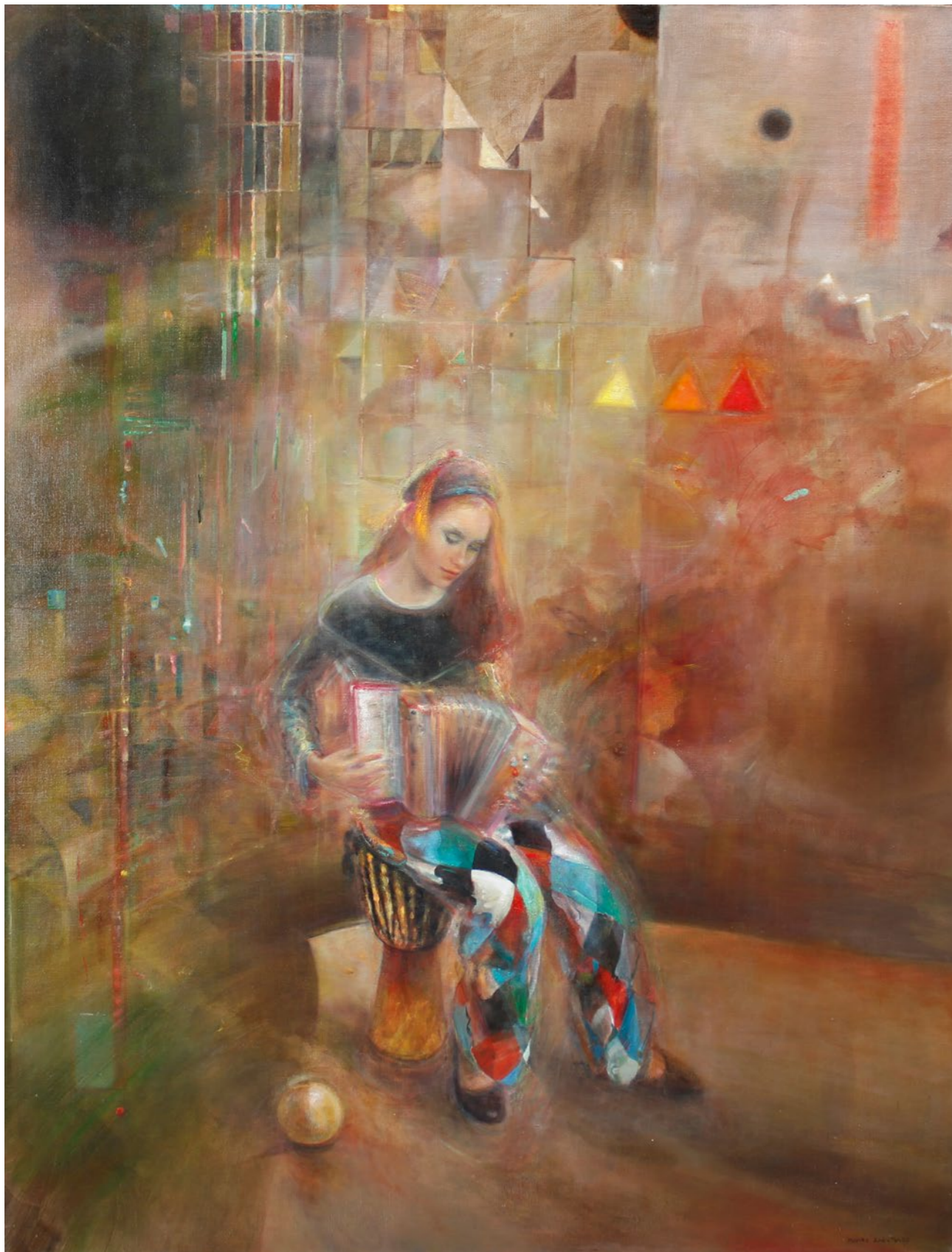
Akiro Miro 130x100cm olej na płótnie 2015