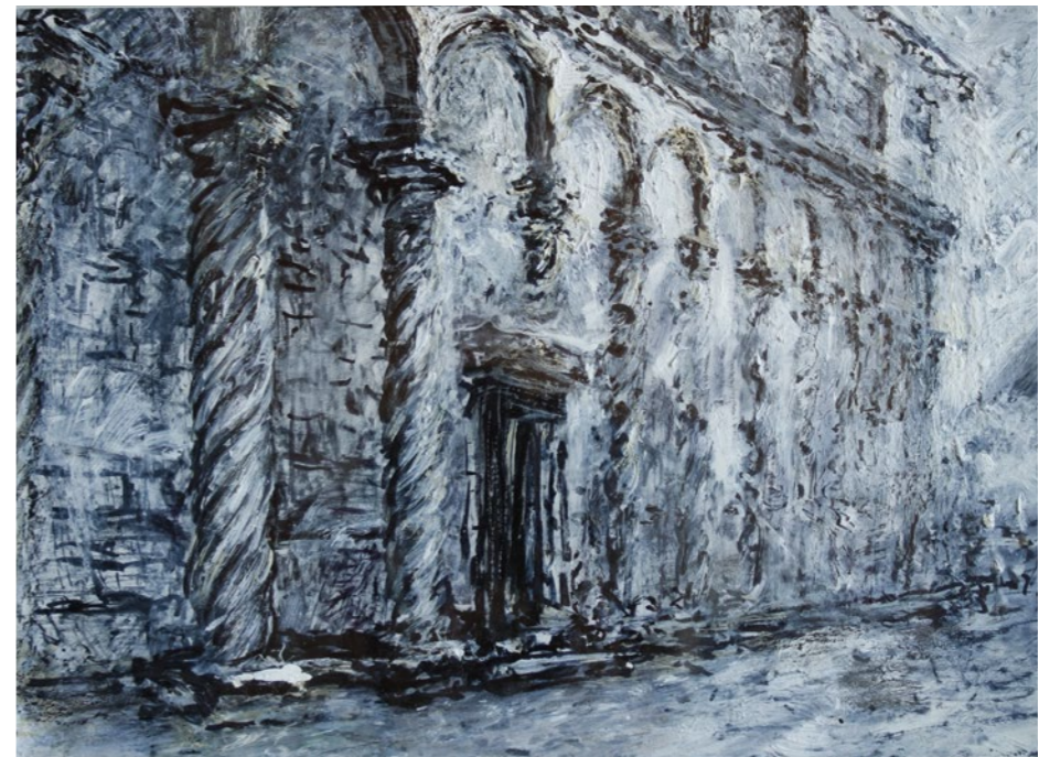
Szary „Zadar” 20x28cm rysunek 2014