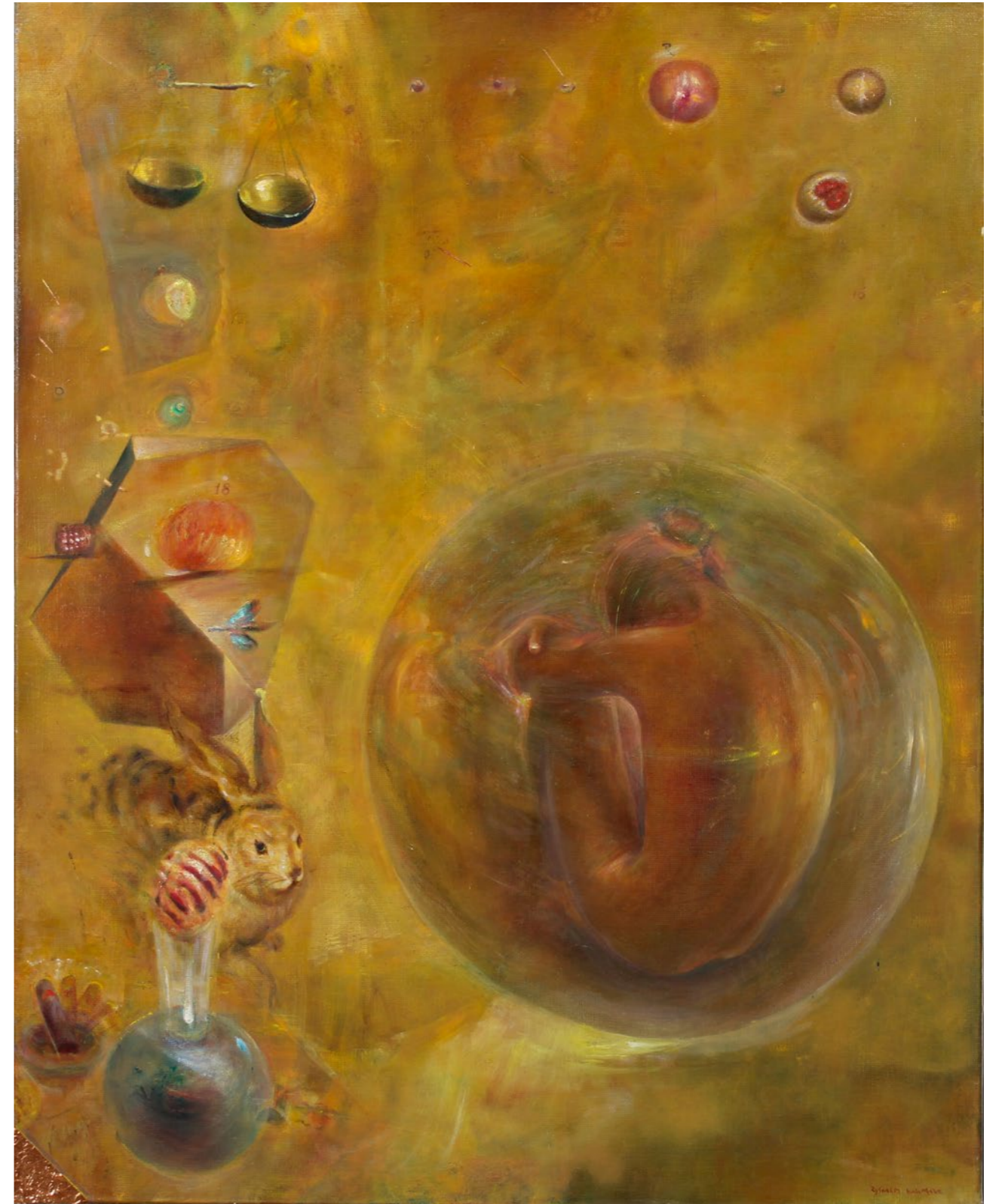
Czerwiec polski 100x80cm olej na płótnie 2011