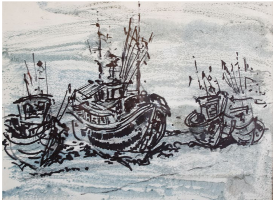
Kutry-Unieście 20x28cm rysunek 2019