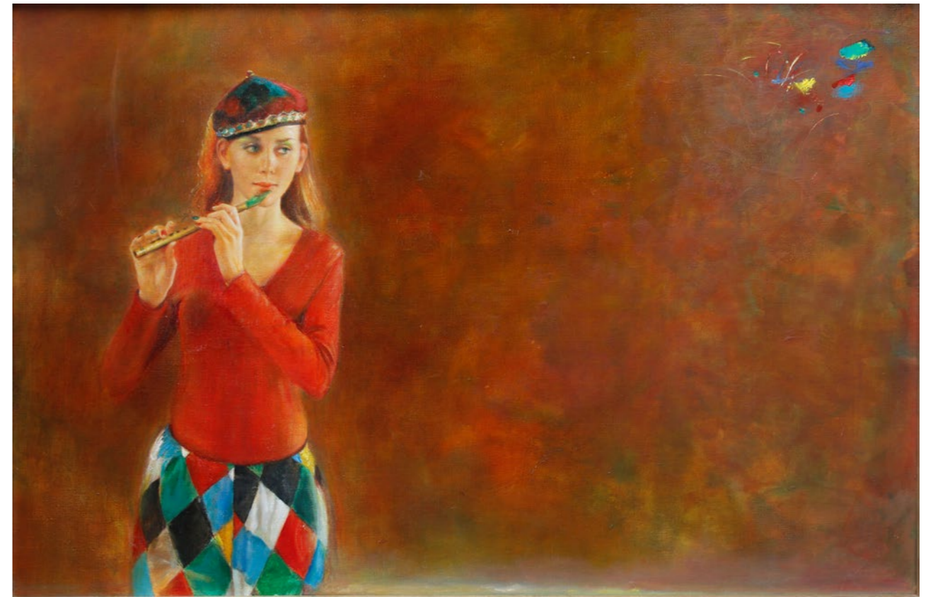
Melodia dla młodzieńca z Krety 80x120cm olej na płótnie 2016