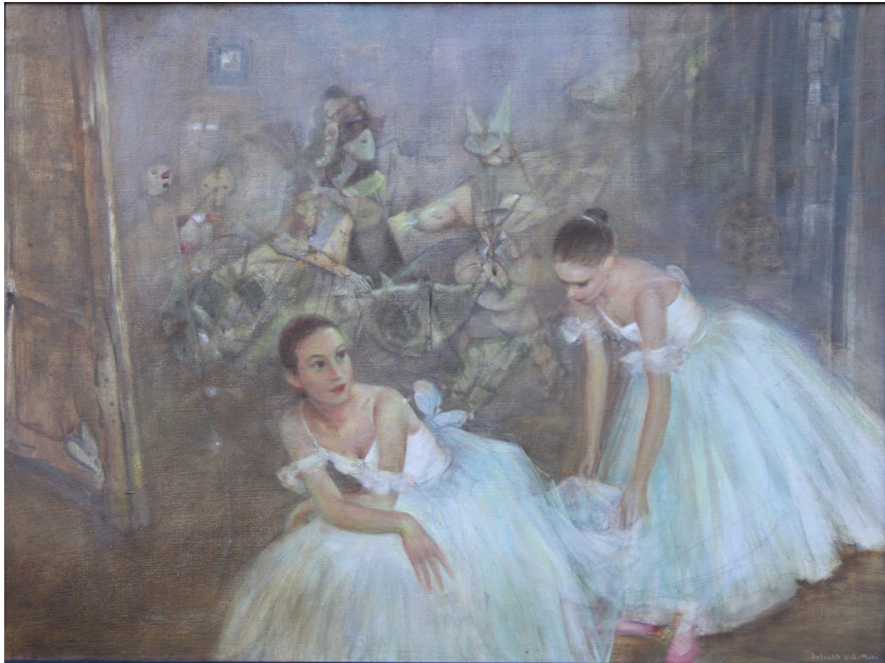
Taniec według Bruegla 60x80cm olej na płótnie 2022