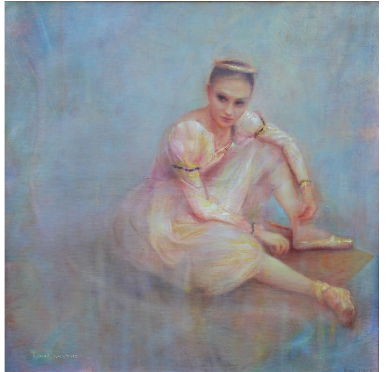
Błękitna poświęciata 90x90cm olej na płótnie 2022