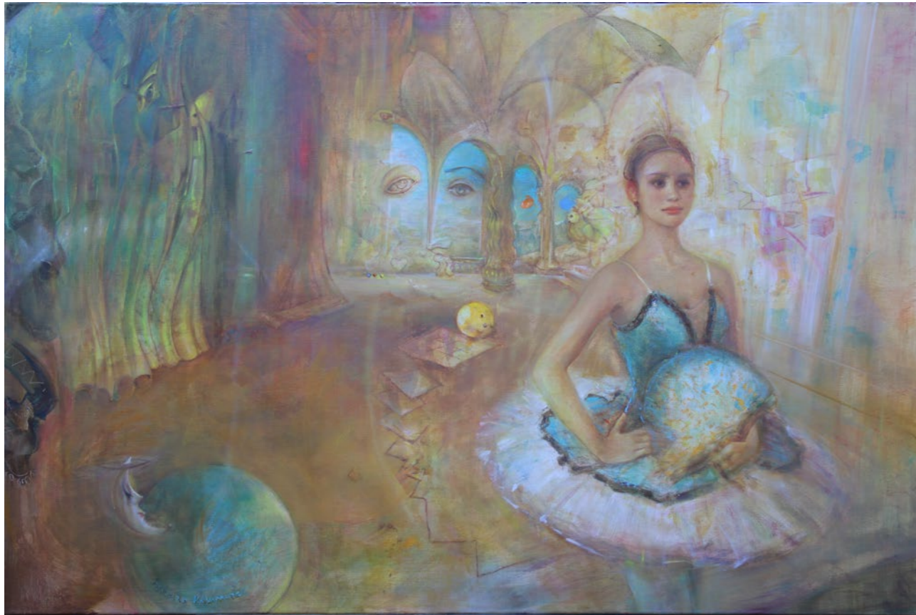
Scenografia 100x150cm olej na płótnie 2023