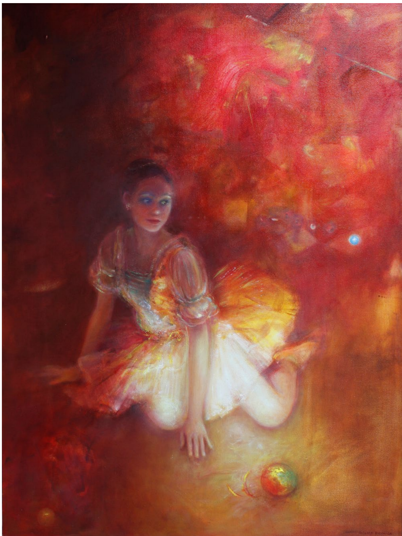
Studium w szkarłacie 120x90cm olej na płótnie 2020