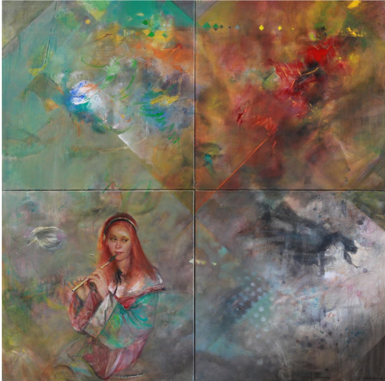
Wiosna, lato, jesień, zima i znowu wiosna 160x160cm olej na płótnie 2017