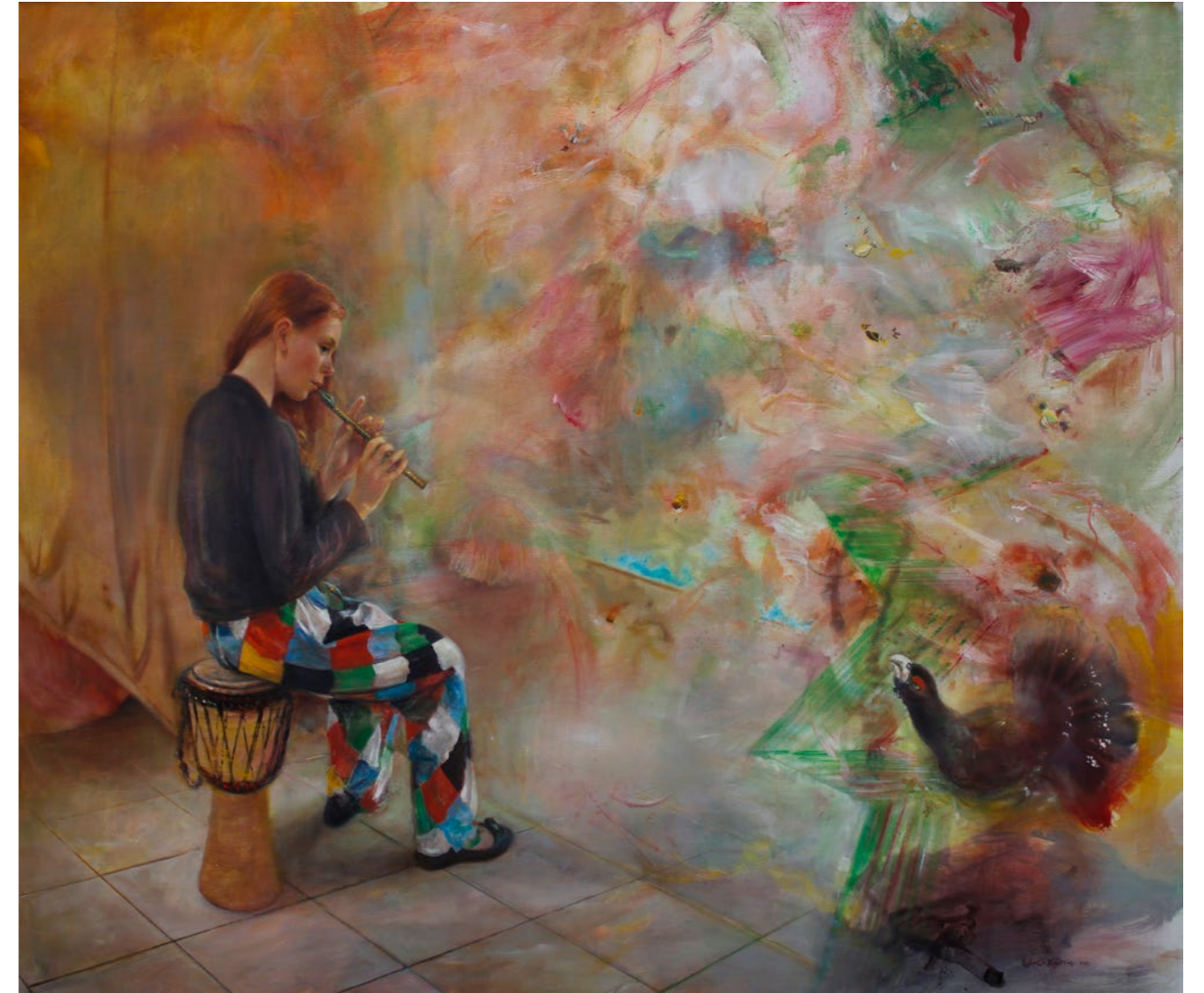
Impresja II z głuszcem 142x166cm olej na płótnie 2017